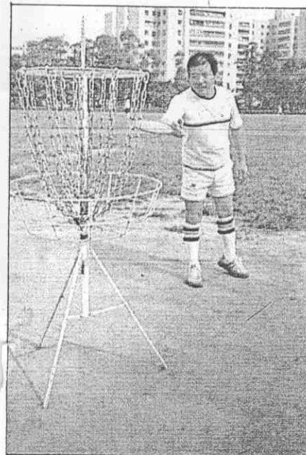
敲再用不賽比，架籃夫爾高盤飛了有 。幹樹