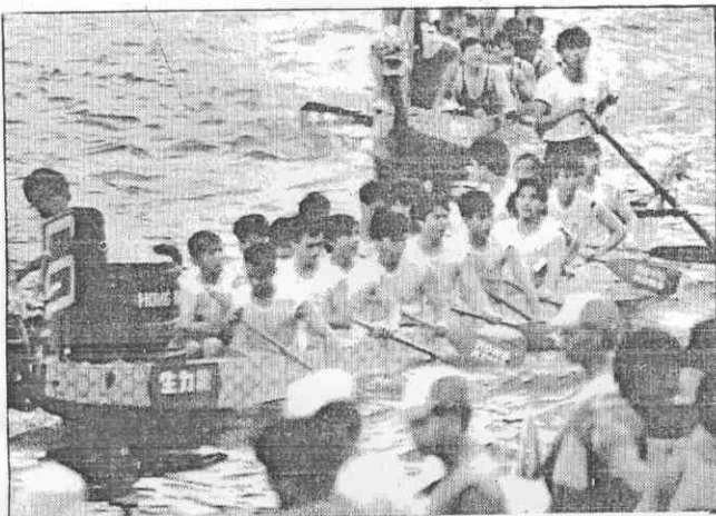
▲香港國際龍舟賽的盛況。