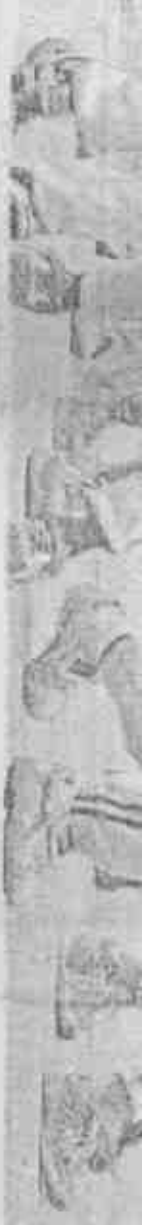
少棒賽冠軍 第幾次參加諾羅山盃：第12次