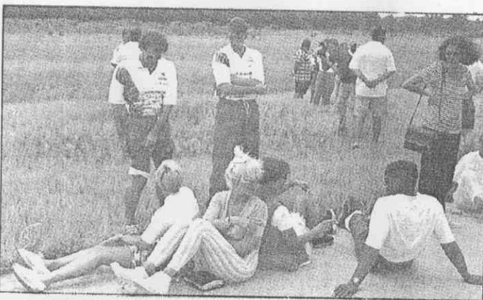
↑荷蘭隊六日從奧蘭多準備搭機飛往達拉斯時，一名記者說稱他帶了炸彈，安全當局搜索飛機時，荷蘭隊員和他們的妻子在機場跑道邊等候。

而戰，一切應以全隊的成績為重，而他個人更是德國歷史上代表國家隊出賽最多場數的沙場戰神，目前的一百一十六場國際賽紀錄，雖然還不能破英國席爾頓的一百廿五場國際賽世界紀錄，但眼前他倒很可能先破世界杯的廿二場出賽最高紀錄。