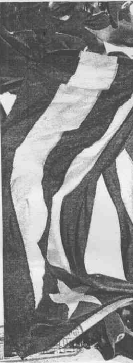
▲古巴澳洲奧運金牌戰，古巴隊獲得欣喜若狂的古巴國奧運旗隊慶祝團體

們甚具意義，今年奧運，我們得到很多實力很強的球隊，但我們經苦戰之後，一一過關，終於拿到期盼已久的金牌。」 奧運銅牌戰日本以11：2擊敗加拿大，各隊名次分別是金牌古巴、銀牌澳洲、銅牌日本、第四名加拿大、第五名希臘、第六名荷蘭、第七名希臘、第八名義大利。