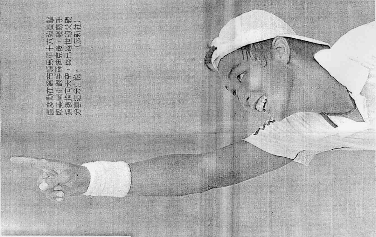
盧彥勳在溫布頓男單十六強賽擊敗美國重砲手羅迪克後，親吻手指後指指天，與已過世的父親分享這分喜悅。