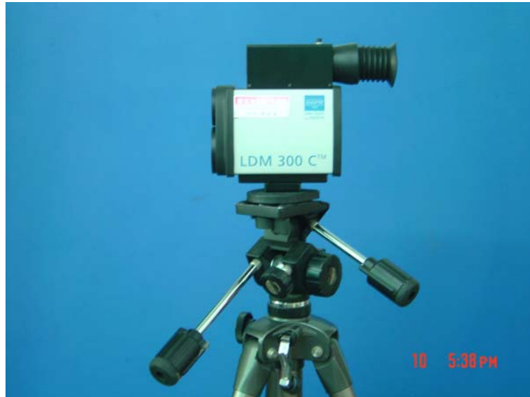
圖 1：雷射距離測量系統（LDM module 300C）