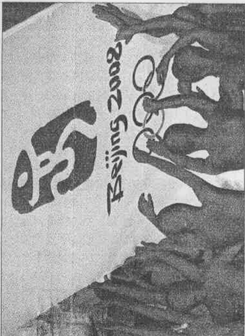
北京二〇〇三年在天壇舉辦盛大儀式，公布北京奧運會徽，紅色的舞者簇擁著，像是為奧運加油的。