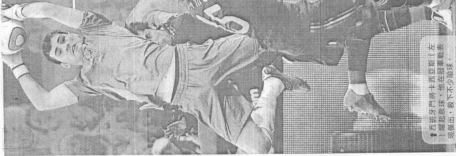
↑西班牙門將卡西亞斯(左)躍起救球，他在冠軍戰表現傑出，救下不少險球。

因南非治安差，西國球星女友友都不隨行，但莎拉是西班牙首席體育記者，每場比賽擔任訪問工作的她，昨天當然也採訪了奪冠功臣的男友卡西亞斯。