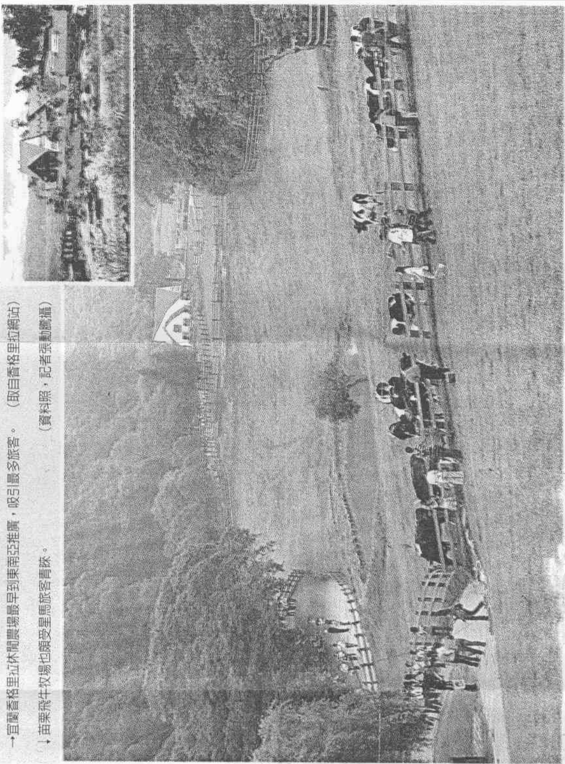
→宜蘭香格里拉休閒農場最早到東南亞推廣，吸引最多旅客。 ↓苗栗飛牛牧場也頗受星馬旅客青睞。

由於東南亞市場近年來已成為日韓之外，來台旅客人數最多區域，吳朝彥表示，預計十月二日在馬來西亞吉隆坡設立新的辦事處，同時邀請蔡依林、吳念真為新的代言人，並加強宣傳活動，本週末邀請九十九對星馬情侶與蔡依林在船上共進浪漫晚餐，希望吸引更多東南亞民眾來台。