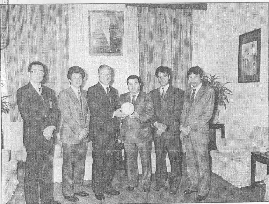
▲ 李總統登輝先生接見旅日棒球投手郭一莊。