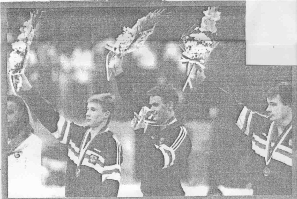
(真傳城漢團訪採運奧報本)。金柳、夫莫提阿、(起右)夫契色羅畢手好聯蘇的名三前能全辦包

日本的池谷幸雄得第八名，一一七點六七五分，水島宏一第十名，一一七點六二五分。全能名次為：①阿提莫夫(蘇)、②柳金(蘇)、③畢羅色契夫(蘇)、④第貝特(東德)、⑤高爾曼(羅馬尼亞)、⑥王崇升(大陸)、哈里斯托黑夫(保加利亞)並列。