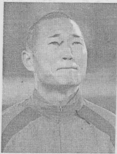
↓鄭大世(前)代表北韓迎戰巴西隊，全場飛奔，雖然沒替北韓進球，仍是全場的焦點。