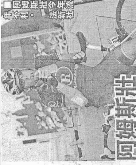
■2008、2009年日衫冠軍的施雷克昨奪下單站冠軍。

開賽馬上出撞況 昨晚一開賽就不平靜，開跑僅7公里主集團包括阿姆斯壯、總成績排名第2的伊凡斯和圓點衫的法國車手班尼攸(I.Pineau)等10多名車手就發生大摔車，但阿姆斯壯等名將都能脫困在隊友幫助下順利趕回集團。 進入首個1級爬坡時，包括黃衫夏伐尼爾和阿姆斯壯都從主集團中開始落後，壯哥雖卯足勁緊追，但半途又受到其他車手補給車影響，導致阿姆斯壯又停下速度，讓前環法冠軍車手也只能徒呼無奈。