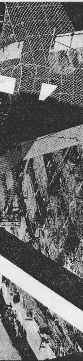
▲北京奧運的主體育場「鳥巢」，設計太過新穎，為施工帶來許多困難，開工至今的施工意外，即被質疑與設計有關。

成功之初，安保部門就將奧運反恐作對於大規模的恐怖襲擊，北京警方也在專門成立的北京奧運會反恐應急指揮下，由幾千名裝備精良能力超強公安局特警總隊，屆時將起到反恐尖