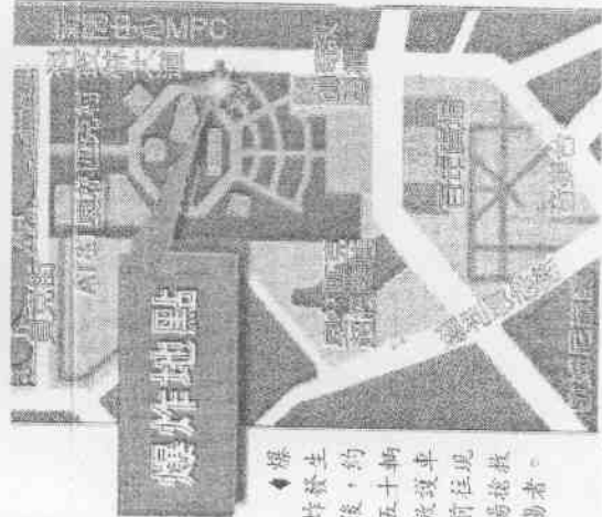
爆炸發生後，約五、十輛救護車前往現場搶救傷者。