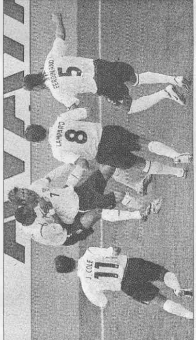
▲⑦貝克漢成了「助攻」功臣受隊友稱賀，英格蘭就靠記「烏龍球」1:0獲勝。 ▼巴拉圭隊長④卡馬拉試圖頭槌化解危機，未料角度偏差，球反朝自己的門前而入。

【記者李亦伸／綜合外電報導】期待40年後重奪世界杯冠軍的英格蘭，10日靠著巴拉圭隊長卡馬拉在開賽三分鐘的一記烏龍頭槌助攻，以1:0力克巴拉圭。