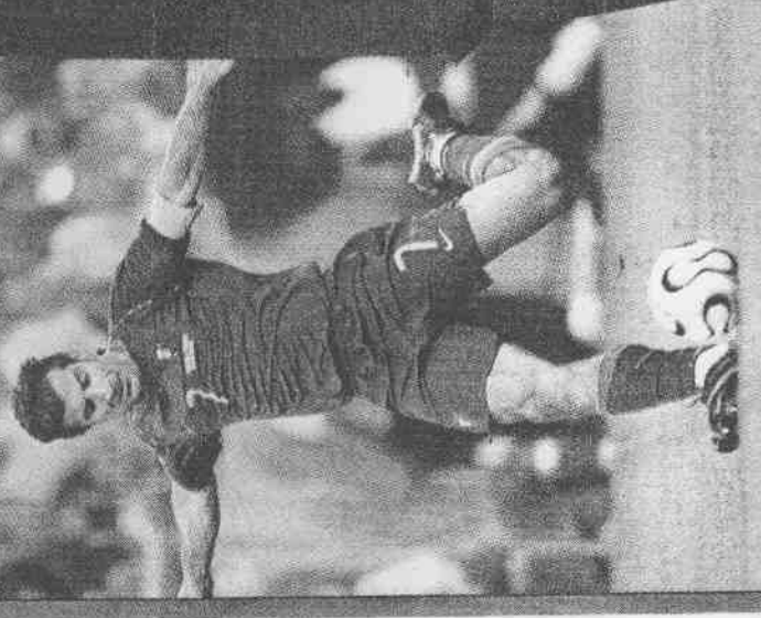
▲葡萄牙中場大將菲戈(7號)躍起頭槌未能成功，法國終場以1：0獲勝，晉級決賽。

葡萄牙隊後衛卡瓦奧一直對裁判的12碼罰球判決忿忿不平，他認為亨利的「假摔」表演欺騙了裁判。但是，這位效力於英格蘭超級聯賽聖西羅的後衛還是覺得，席丹的表現得實在出色，法國隊的勝利多半是靠這位34歲老將的發揮。 被征服的人還有很多很多，迴蕩在慕尼黑上空的馬賽進行曲就是為席丹所奏，席丹征服了慕尼黑。