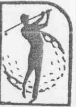
杯路喜登 賽球高界世