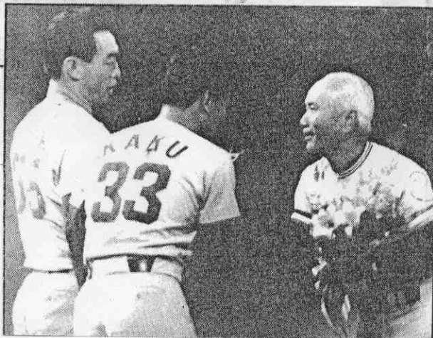
←大郭、大豐向教官獻花。