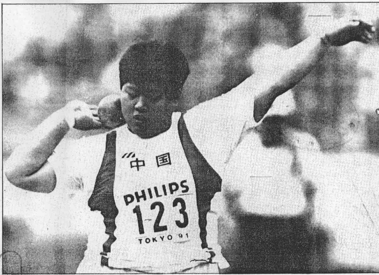
↑大陸隊黃志紅，奪得世界田徑賽鉛球金牌。