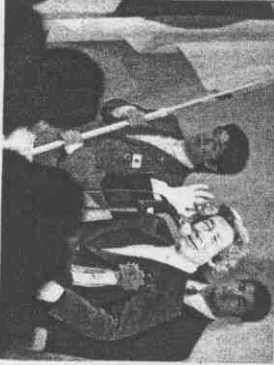
▲日本奧運代表團昨天由首相小泉(中)拔旗，小泉接著激勵也包含金牌有望的角力選手濱口京子(左)、柔道選手岸上康生等選手。

希臘公共安全部長佛格利吉諾說：「我們把所有可能發生的狀況都考慮進去，其中有些是近半不可能發生的事，甚至連爆發第三次世界大戰，但我們是不怕一萬，只怕萬一。」