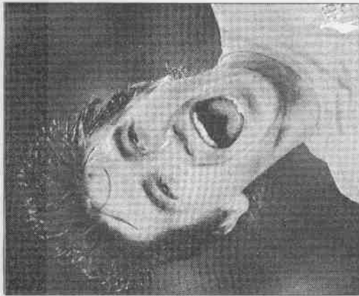
▲澳洲凱威爾在進球後，高興的張嘴吶喊。

足球大師希丁克傳奇，在澳洲上演，舞台在德國世界杯，這齣戲後續如何，應該非常震撼。(李亦伸)