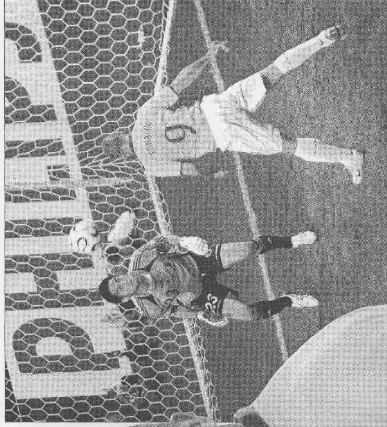
▲巴西羅納度（右）在門前頭槌破網。 ▼一名日本女球迷在日本失球後，眼中的淚水打轉。