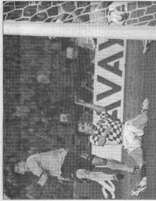
▲澳洲凱威爾(左)在門前射破球網，攻進追平比數的第二球。

自2001年開始效力義大利門祖文特斯球會的捷克主力球員納德維德22日表示，「莫吉門」事件曝光後，祖文特斯隊很有可能面臨降級厄運，因此，他將不再為該球會踢球。