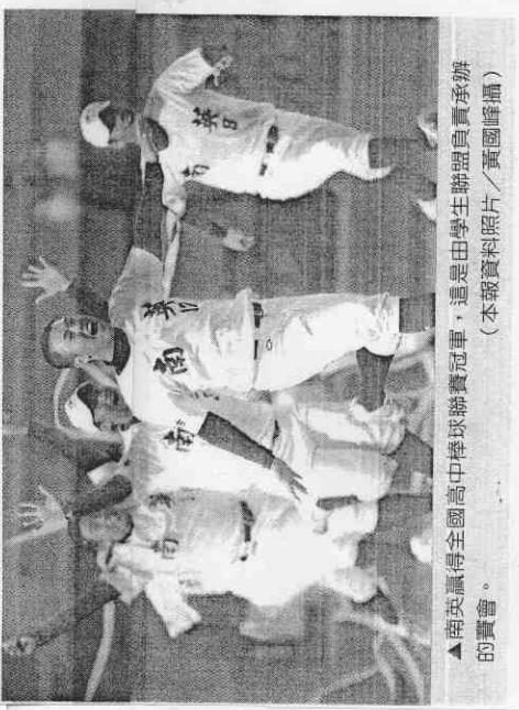
▲南英贏得全國高中棒球聯賽冠軍，這是由學生聯盟負責承辦的賽會。

關心棒球的球迷大概都還記得，去年北京奧運會日本棒球隊連銅牌都沒摸到，但國會議員不曾因而怪罪政府，也不見有哪位內閣官員出面表態，頂多就是總教練星野仙一鞠躬向日本球迷們道歉罷了。惟典奧運時，美國連資格賽都沒過關，遑論去衛冕金牌，政府、民間也沒有任何責難。