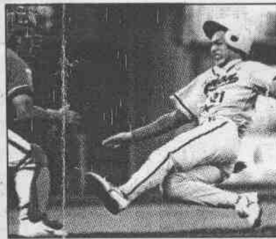
力以赴。球員無論打擊或跑壘都全 ←為了搶下勝利，與農牛