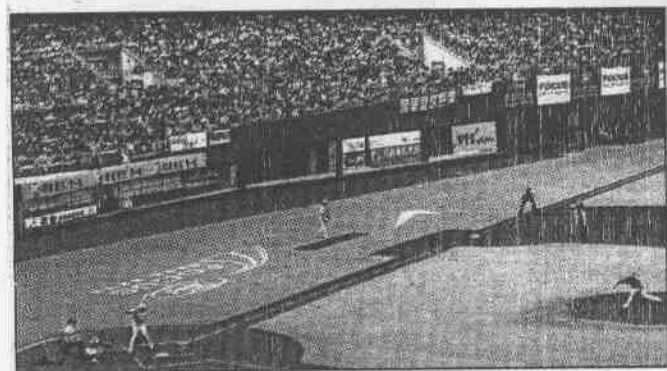
↑統一獅與興農牛總冠軍賽於澄清湖首戰，吸引爆滿觀眾進場看球。