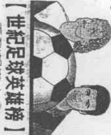
【世紀足球英雄榜】 系列報導之(87)