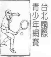
台北國際青少年網賽