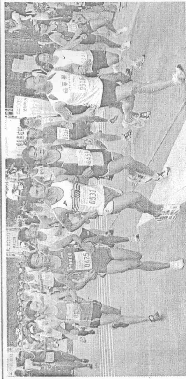
↑ 2010四季馬拉松—秋季金門環島馬拉松賽，昨天在金門國家公園鳴槍開跑，近2000名選手參賽。圖為選手從中山林遊客中心出發。

身兼中華民國路跑協會理事長的立委曹爾忠參加半馬賽，他說，金門像座海上公園，路跑的環境很棒，值得結合觀光休閒推廣長跑運動，花最少的錢獲得最好的健身效果。