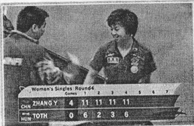
■張怡寧(右)與教練李隼(左)討論讓分的對話，日前曝光。

【大陸中心／綜合外電報導】世界排名第一，日前再度登上世界桌球錦標賽冠軍的中國女子桌球好手張怡寧，日前坦承在比賽中，為了讓對手「不會輸得太難看」刻意放水。她與教練在休息期間討論讓分方式時，一句「我怕她打不著」更透過網路傳至全球。有人認為：「讓分還這麼大聲嚷嚷，太不給人面子，沒格」；但也有人稱：「一句話，就是強」。