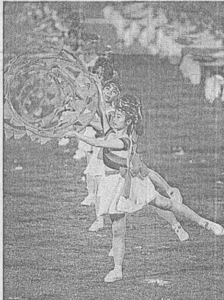
↑東方工商1千位學生舞出「青春旋律」。