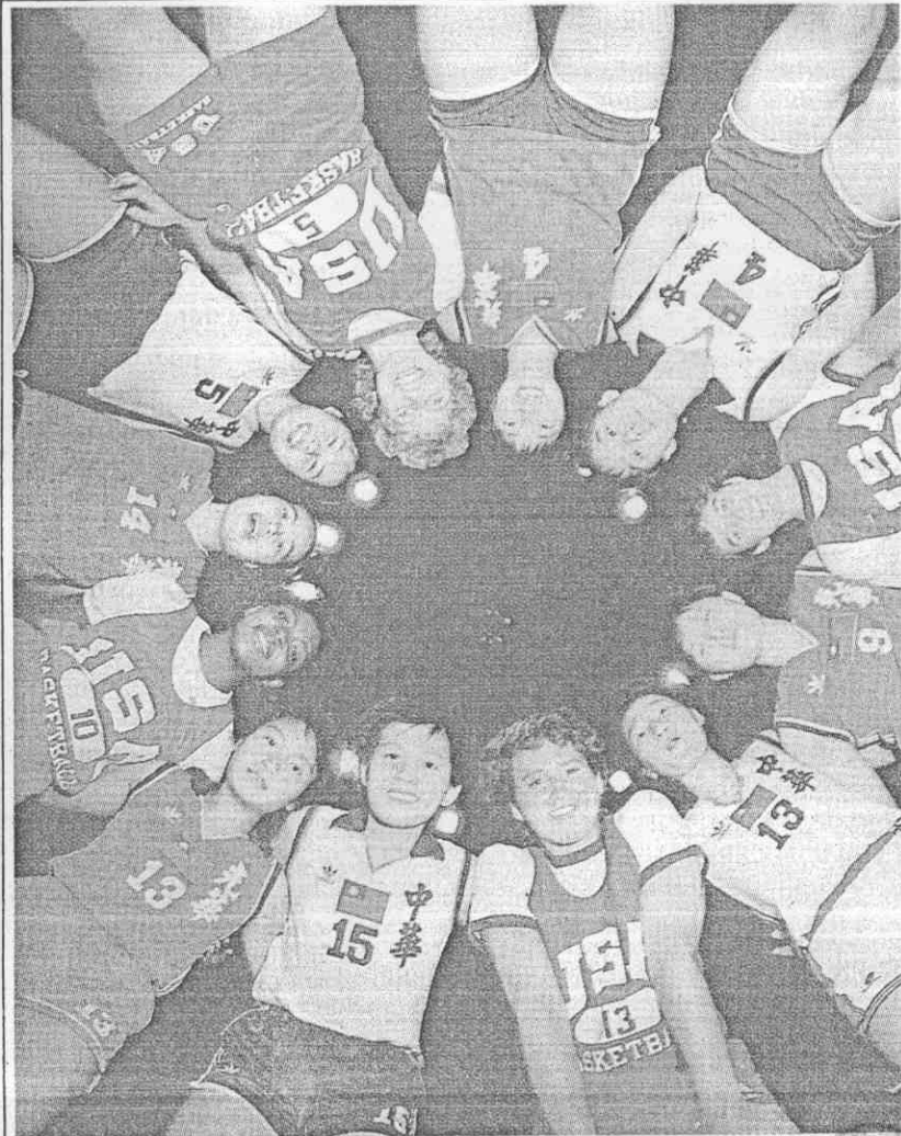
堂一集聚員球美中