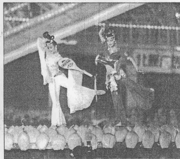
↑「絲路歡歌」舞出中國歷史上的大唐盛事，讚頌先人的成就。