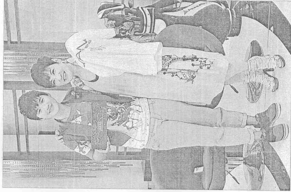
雙后會 ◀高爾夫小天 后曾雅妮(左) )參加中天「 SS小燕之夜」 錄影，與主持 人張小燕(右) )互贈禮物。

上月創下我國世錦賽女雙最佳成績，這回在中國也保持水準。打入4強的程／簡要更上層樓，中國仍是障礙，兩人在瑞士、亞錦賽及世錦賽3度被擋在決賽門外，都是敗給對岸選手。今天對手包宜鑫／陸路為全新組合，包宜鑫今年亞青賽贏得混雙金牌，不容忽視。男單方面，「小天」周天成昨以12比21、11比21不敵第7種子諶龍，無緣4強，本次在江蘇常州的驚奇之旅也畫下句點。