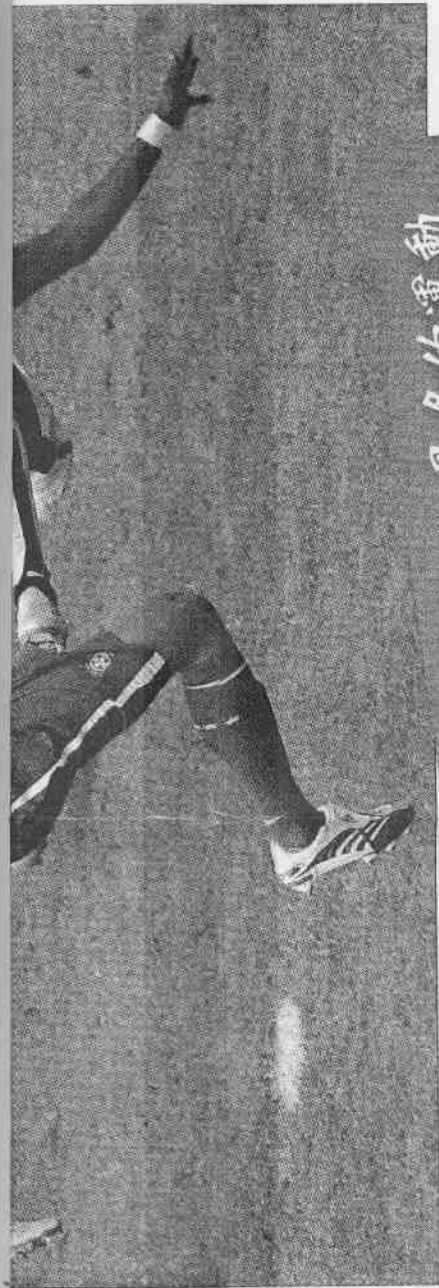
全球觀眾最多的運動

這項研究的發起緣自1998年，英格蘭在PK戰輸給阿根廷隊，賽後心臟病突發的英格蘭人變多。