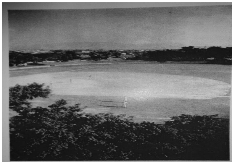
圖三 省立體專棒球場