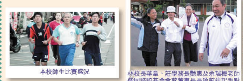
本校師生比賽盛況

學生組比賽成績由體育學系囊括男女乙組團體前五名，其中體育四 A 蟬聯 4 屆女乙組冠軍。各獲獎單位與人員於 12 月 16 日會公開接受頒獎表揚。