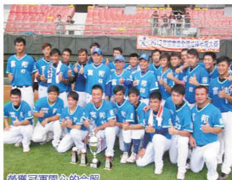
榮獲冠軍開心的合照