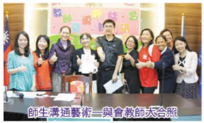
師生溝通藝術與會教師大合照