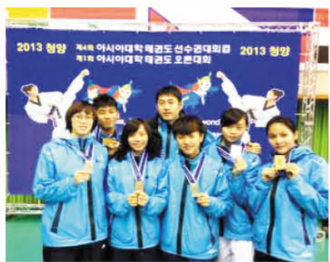
本校選手賽後合影