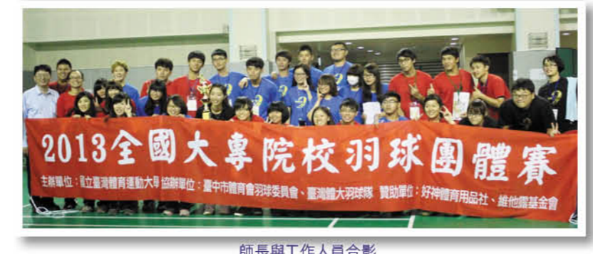
師長與工作人員合影

本次賽會是新教學大樓於 102 學年度上學期正式啟用以來第一次對外舉辦比賽，場地及週邊設施獲得參賽選手好評。經過一日的激烈比賽後，最後由本校休閒與運動管理學院隊分別獲得第一、二名的殊榮，中興大學森林系及臺中科技大學流通管理系則並列第三名。