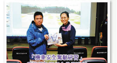
機車安全駕駛研習