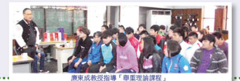
康東成教授指導「舉重理論課程」

舉重隊教練與選手 18 人參加 10 月 28 日至 11 月 1 日韓國移地訓練計畫，感謝韓國安教授、康東成教授、元珍姬教練及韓國體大選手的協助。康東成教授全程以英語方式進行理論教學，從淺入深，理論與實務並重，強調身體比例原則，並強化腹部肌群等重點，分享他們目前技術發展之困難，如韓國選手普遍支撐前偏等。本次讓學生到國外見識不同舉重之發展、訓練方式與技術指導，拓展學生國際視野。