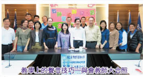
教學上的聲音技巧與會教師大合照