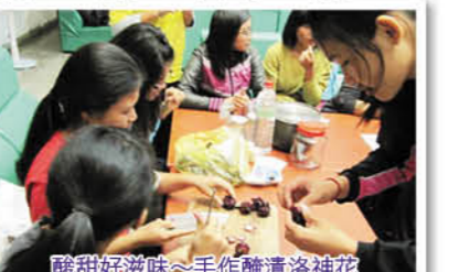
酸甜甜滋味~手作醃漬洛神花