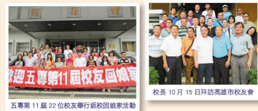
校長 10 月 15 日拜訪高雄市校友會