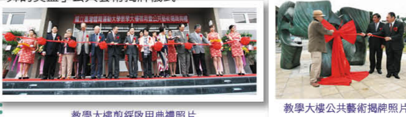
教學大樓剪綵啟用典禮照片

臺中校區教學大樓於 11 月 20 日上午 9 時 30 分由臺中市蔡副市長炳坤、楊立法委員瓊瓊、陳立法委員若涵與本校歷任校長共同剪綵，並在全校師生見證下正式啟用，同時舉鑿藝術家余煜銓先生創作之「起舞的獎盃」公共藝術揭牌儀式。