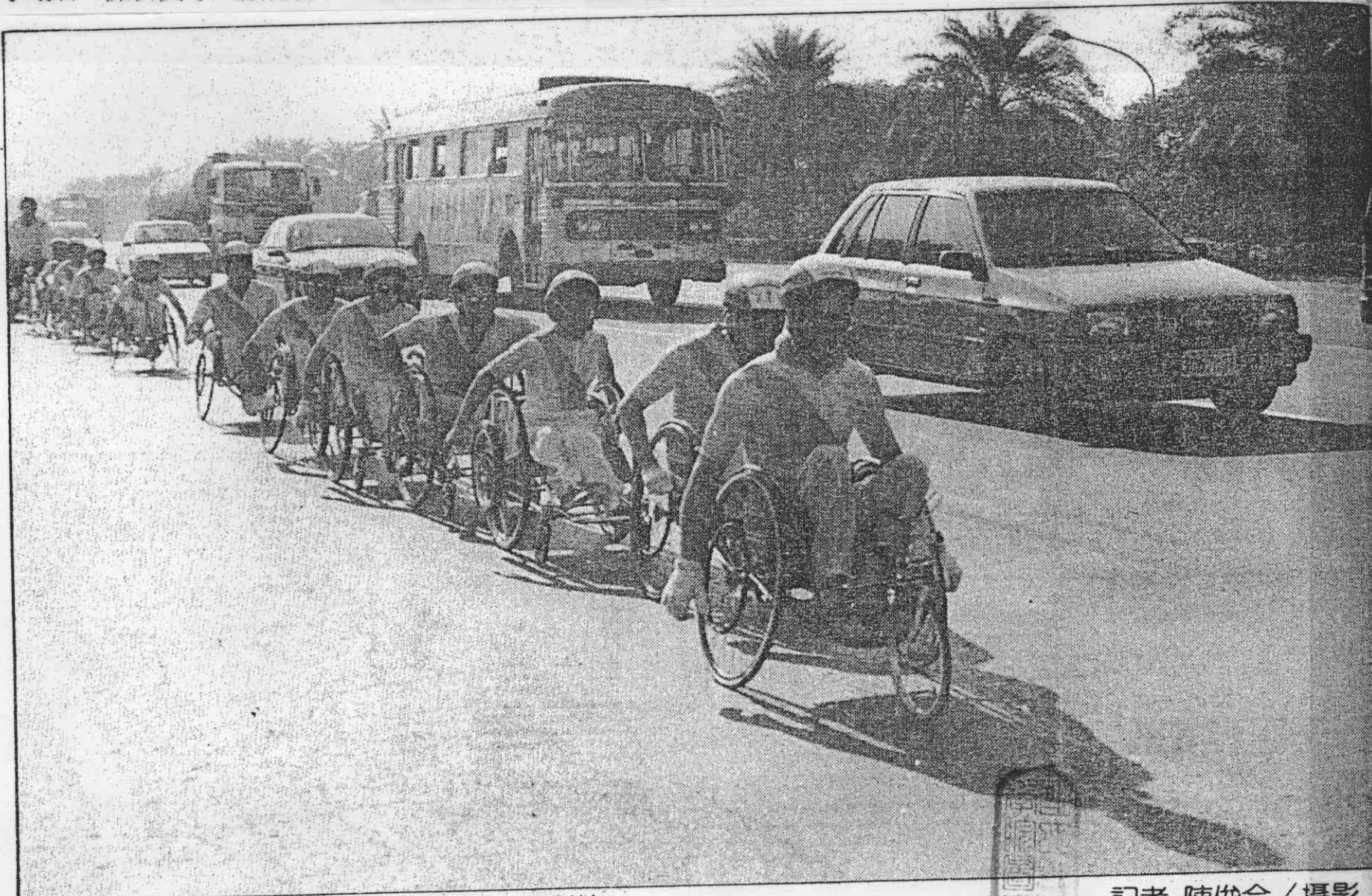
↑輪椅勇士進入高雄市，和如流車陣成對比。

今天上午6時半，輪椅馬拉松選手將由高市中山體育場出發，飛馳在省公路上，希望駕駛朋友注意行駛及為選手加油鼓勵，途經岡山、台南市至新營夜宿。