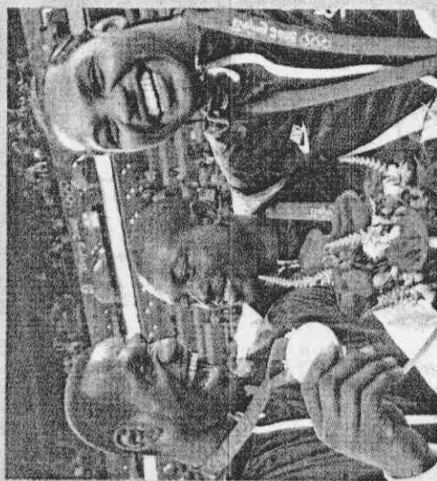
美國隊陣中「同梯」的詹姆斯（左起）、魏德與安東尼興奮地抱在一起，慶賀拿下奧運金牌。