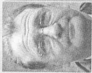
洋基總經理 凱許曼