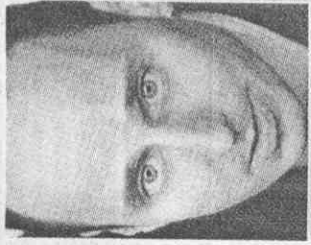
王建民經紀人 尼洛