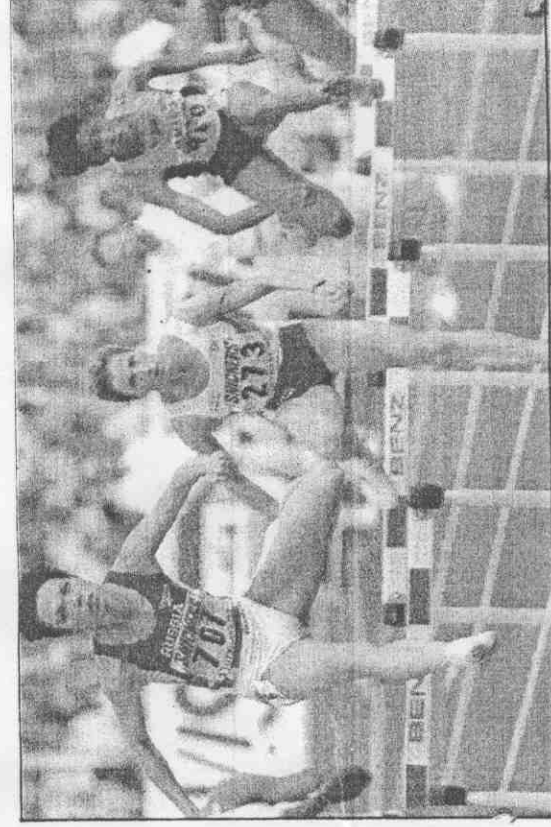
←英國選手古妮兒(中)在女子四百欄決賽時打破世界紀錄。 ↓牙買加選手奧蒂(右)19日終於在世界田徑賽中贏得女子二百公尺金牌。