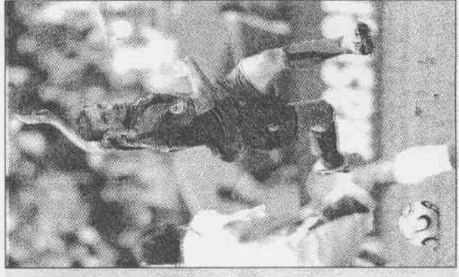
▲小組賽未丟一球的瑞士（左），希望繼續維持「完璧之身」。 ▲烏克蘭核彈舍甫琴科，對瑞士之戰能否再度引爆，球迷注目。 ▶義大利老將托蒂警告隊友，面對澳洲千萬不可大意。