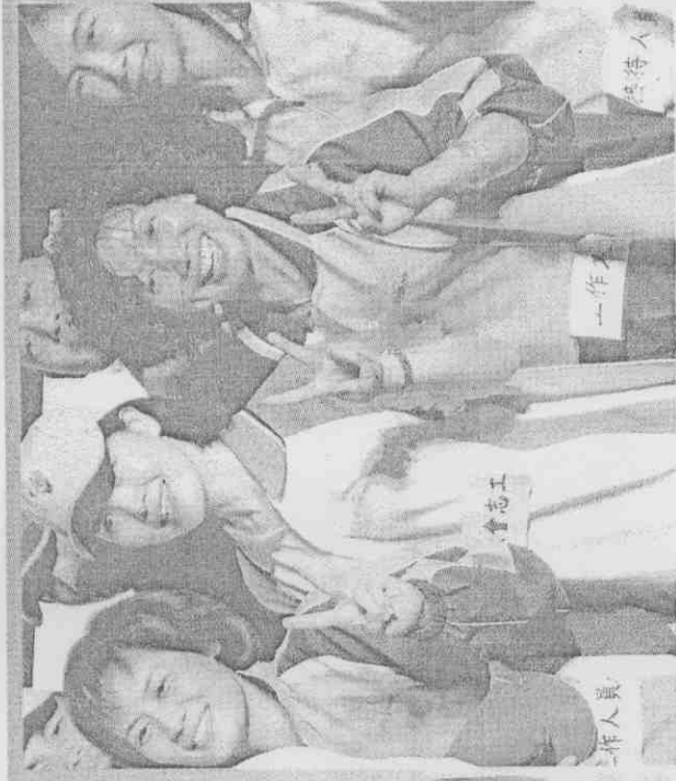
↑中市國小女校長昨天化身模特兒，穿上全運會大會工作服裝亮相。 ←人體彩繪「超合身」運動衣超吸睛！可惜只有她穿最好看啦！

體彩繪運動服之後覺得惡心。有藝術家分析，台中市旅遊協會促銷大坑竹筍，企圖以「秀色可餐」的畫面博版面，讓只穿基尼尼的女郎躺在餐桌上，以身體當餐盤，在餐點部位，擺滿沙拉涼筍，供民眾取用，結果引起很多女性撻伐，有人還表示，人體會流汗，不僅給人感覺下流，還兼不衛生！