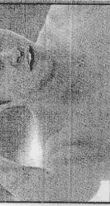
日本蛙王北島康介，順利衛冕奧運雙金。

劉子歌賽前並不被看好，不過預賽以第一名游進決賽後，就被喻為黑馬，靠著「水立方」主場優勢，在比賽後半段展現爆發力，果然在最後50公尺甩開其他人，為中國奪下本屆奧運第18金。