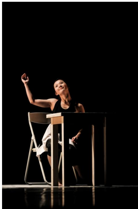
圖 3

舞碼內容中除了用簡單文字出發編創外，第三段也加入些許意識形態，針對筆者自己內心的自我矛盾，不安，恐慌，在動作質地上略顯緊繃及速度上的改變，至最後快結束前撥髮纏頭之動作，直到坐回原點，微笑愜意的收場表達惱之人事物最後還是得回歸原點，做自己還是最自在，哪怕缺點恐懼佔據充斥心靈作為結束。