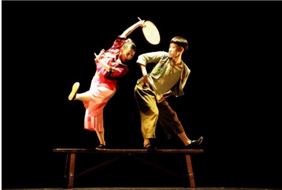
圖 6