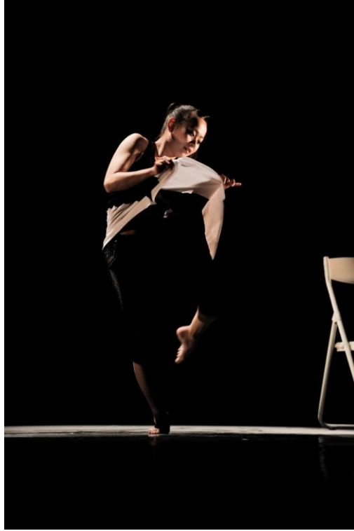
圖 2