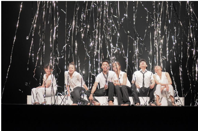
圖 5

面對後期所產生的問題，如呈現不出《情歌》中，男女之間沉浸在愛裡的甜蜜感；除了質地上的尚未區隔清楚，另方也許是因當初從微型劇場表演形式出發，透過近距離的互動舞者和觀眾是很清楚看見每個細節，因此當微劇場的細部設計到了有距離的大舞台上時，卻得下功夫去修正之中的落差，當筆者及舞者們多一些情感的投射，眼神的交流，肢體更多一點的碰觸，讓情緒的關係自然產生動作行為，使其舞動展示出情緒的效應，在舞台上「真正」的戀愛、依偎，玩耍，瘋狂這問題就都得以解決，因此，了解動作的做法與質地外，唯有真正投入角色及故事中，才能將《情歌》所要表達的傳達給觀眾並而產生共鳴。