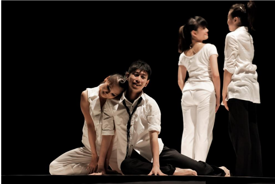
圖 4