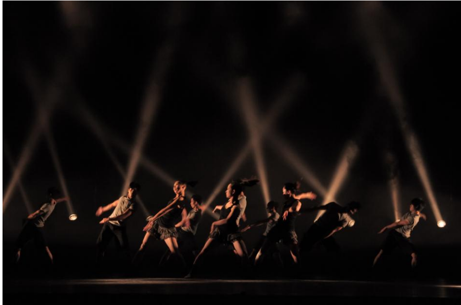
圖 7 / 攝影：陳柏殷