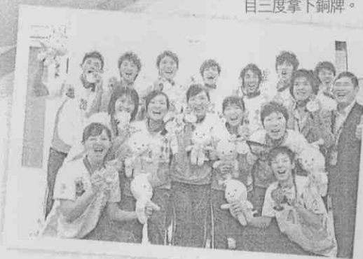
台灣隊在世運合球項目三度拿下銅牌。