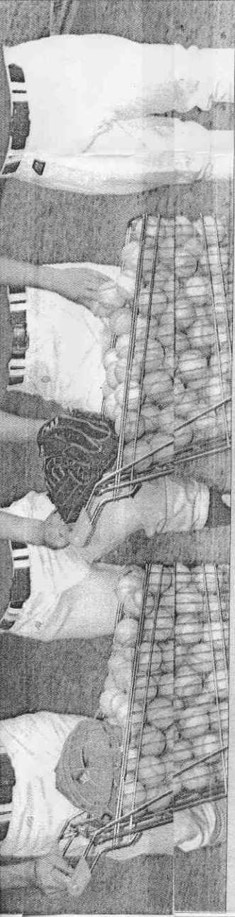
與其殺豬公 不如上太空