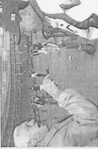
▲2006年經典賽中華隊出賽前，大聯盟著名教練拉索達（左）向中華隊總教練林華章表達他對中華隊戰力的看法。

職棒、業餘的急傾，使得台灣棒壇幾乎處於停頓狀況，看著其他國家棒運不斷精進，「追不到前者、後有追兵」，壓縮台灣棒球的活動空間。教練問題與球員問題一樣重要，職棒、業餘球界若不加以改善，也會成為拖累台灣棒運的負擔。