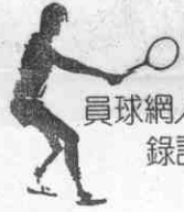
員球網人華美旅 錄訪採迴巡