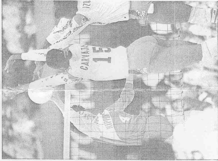
↑古巴球員彈性優異，攔網奇佳封住日本④山內扣球，直落三勝。

至於古巴何以能由7:13落後的情況下一路苦追，反以15:13後來居上，並以直落三贏得最後的勝利？歐亨尼奧表示：