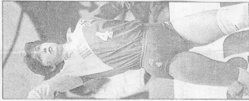
↑日本隊④山內美加，在日本擁有眾多球迷。