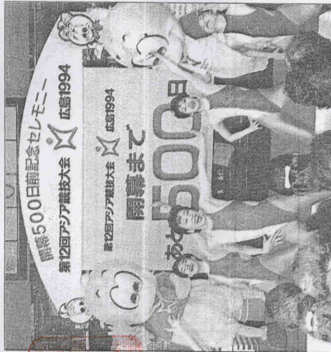
↑距亞運開幕五百天時，廣島的慶祝活動。→廣島亞運的主運動園區。