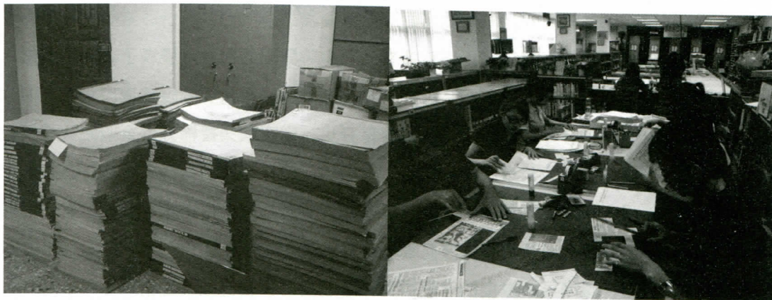
圖一：高雄師範大圖書館轉贈之原版報紙圖二：工作情形之一角