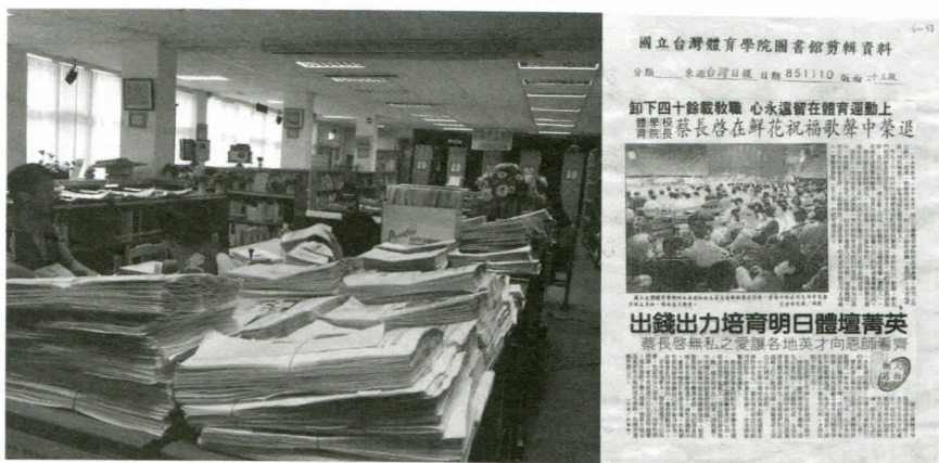
圖三：掃瞄前的半成品堆積如山圖四：剪報製作完成後的樣張

有了前一年的績效，及有紀律的系統化分工合作的工作流程，更為重要的潛在利益是「經驗」的累積，因為資料建檔、分類、關聯作業、格式的一致性、甚至取捨的標準……等等，再再都是需要有一道看不見的「標準」，否則這十幾萬筆的資料豈不成了一堆互不相干的稻草嗎？這看不見的「標準」就是「經驗」，用再多的錢或再多的人，短時間之內都換不來的寶藏。後文檢討時，會指出誰毀了這用再多的錢也買不到的「經驗」。