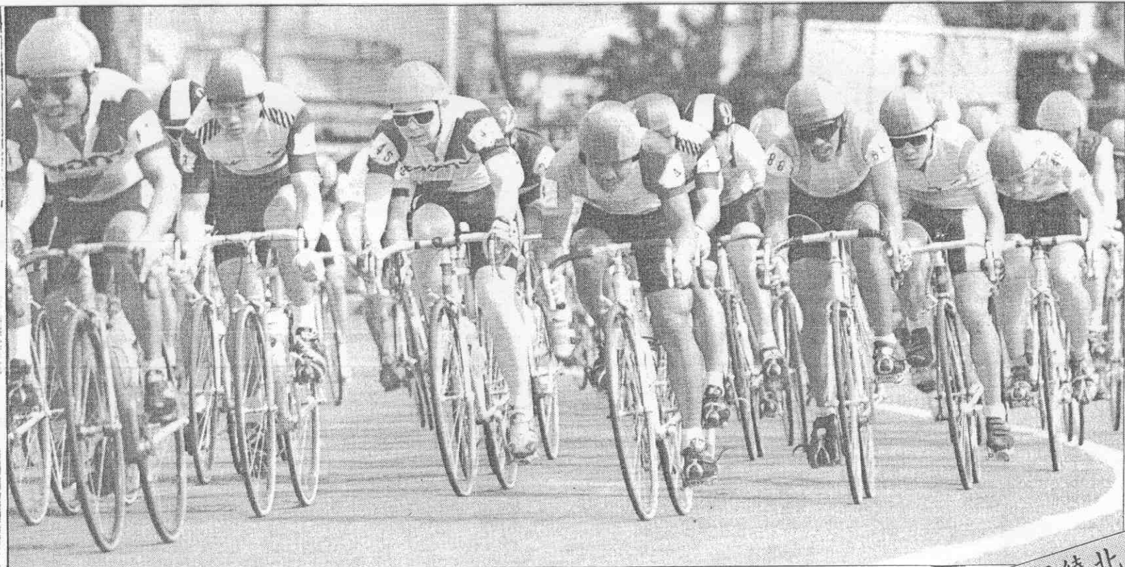
◀國際自由車環台邀請賽百餘中外好手在寬敞的士林中正路上並駕齊驅，場面壯觀。